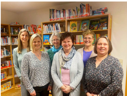
Ein Teil des Teams

Das Team besteht aktuell aus 8 ehrenamtlichen Mitarbeiterinnen und einem Mitarbeiter.